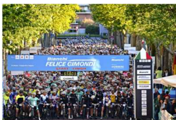
過去のBianchi FELICE GIMONDI RACE