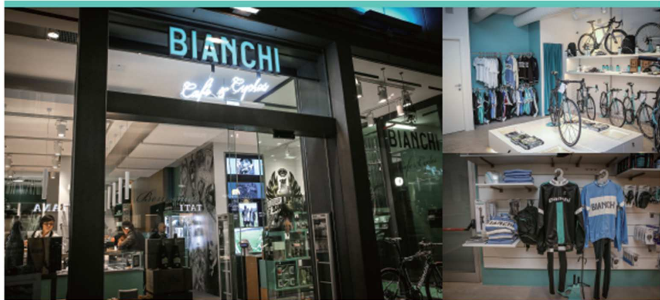
Bianchi Cafe & Cycles [Milano]