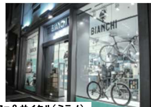
ビアンキ カフェ&サイクル(ミラノ)